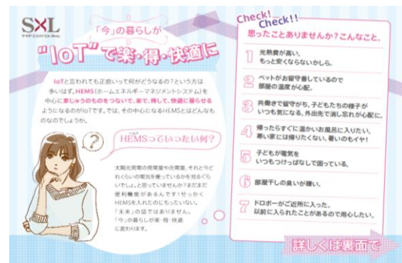
【女性活躍推進チームサポートのIoTリーフレット】

そういった背景から、特に共働き子育て世帯の女性に、分かりやすくIoTの生活をイメージしていただけるよう、当社では収納提案などでも実績のある「女性活躍推進チーム」を中心にリーフレットを作成し、女性目線のIoT訴求活動を行っております。