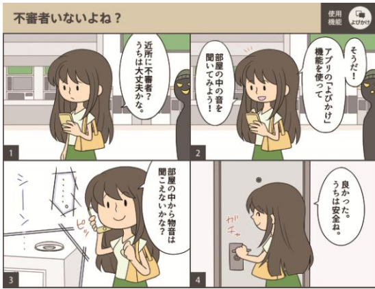
【マルチファンクションライト機能の一例】

この度、ソニーネットワークコミュニケーションズ株式会社のサポートを受け、IoTを駆使して多彩な機能を提供する照明器具“マルチファンクションライト”を業界初、戸建住宅に搭載いたします。