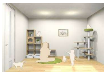
ペットと触れ合う場所に