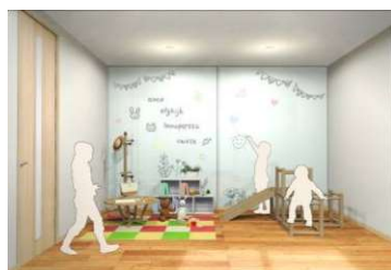
幼少期のキッズルーム